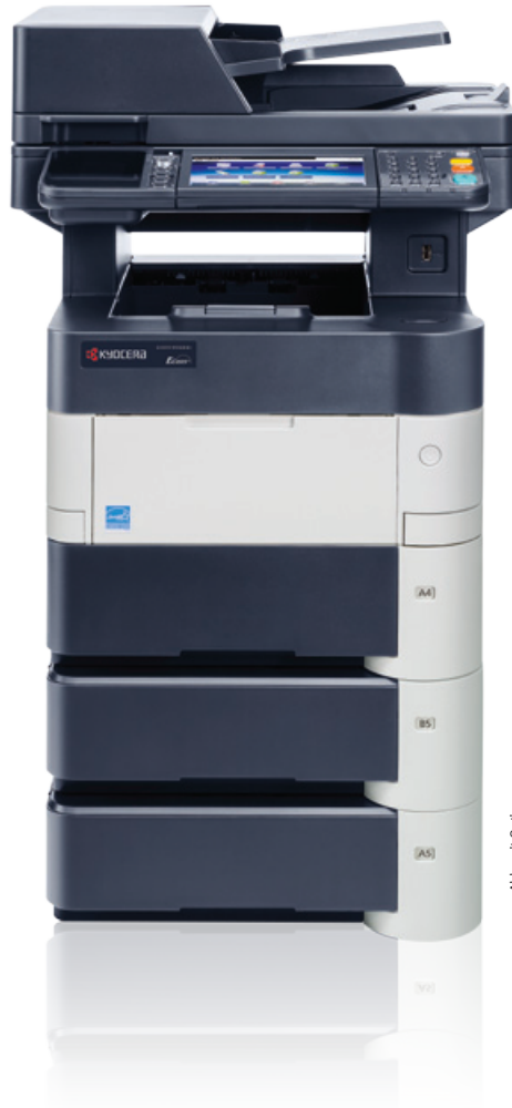
Abb. mit Optionen